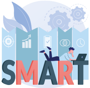
Schritt 1: Anpassung des Lehrplans