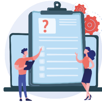
Schritt 2: Bewertung