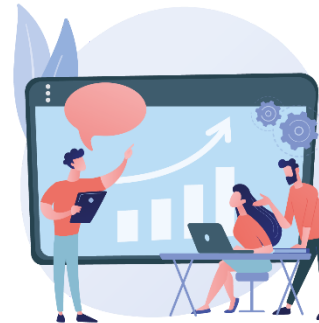
Schritt 3: Lehr- und Lernstrategien