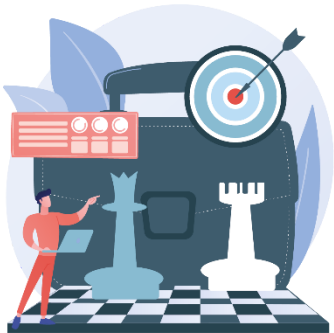
Schritt 5: Zeitpläne, Terminplanung und laufende Überwachung