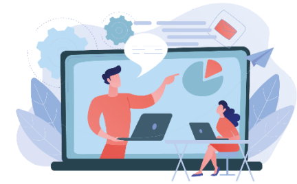
Schritt 4: Infrastrukturbedarf und Anpassungen