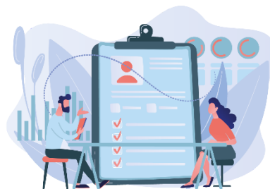
Schritt 6: Kontinuierliche Bewertung und Unterstützung